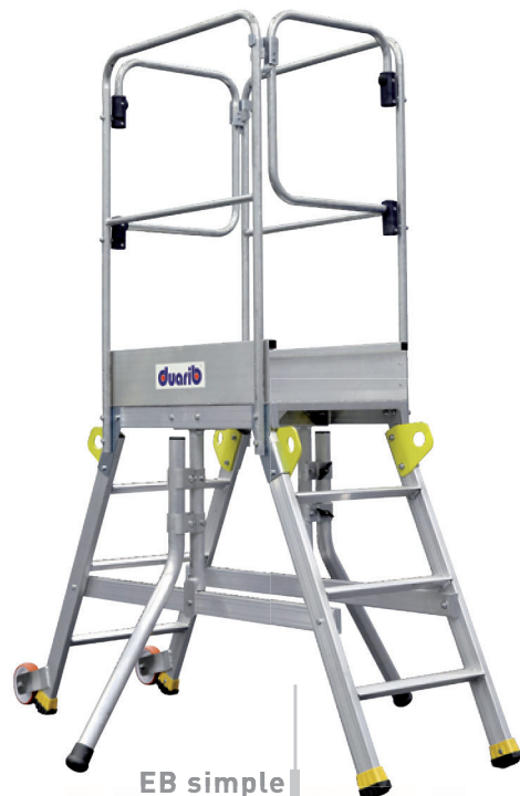
EB simple 4 marches