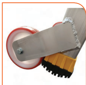
Roues Ø 125 mm. Larges patins antidérapants bi-matière avec témoin d'usure.