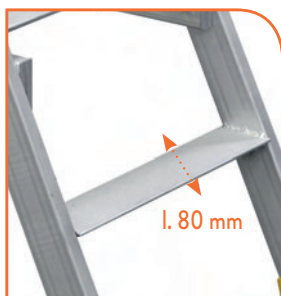
Marches antidérapantes de 80 mm.