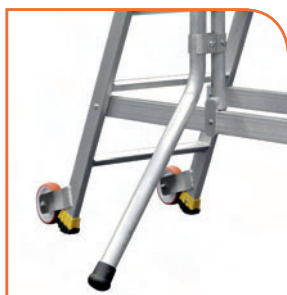
Stabilisateurs orientables et ajustables en hauteur.